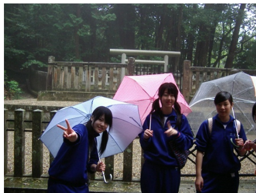
(後醍醐天皇の御陵の前で)

如意輪寺から帰ったあと、昼食をとり、午後1時15分宿舎をあとにした。わずか1泊2日の宿泊研修であったが、中身の濃い研修であった。日頃、教室では見られない生徒の一面を見ることができたし、また、生徒同士の親睦の輪も広がった。2ヶ月前までは「中学生」であった生徒たちが、この研修を通じて「東大谷高校」の生徒に大きく脱皮できたのではないかと思う。今回の研修の目的である「本校の宗教的情操教育を理解する」「躰の指導に基づいた規則正しい行動をとる」「共同生活の基本的マナーを身につける」という成果を十分にあげることができた研修であったと思う。( 文責 南 )