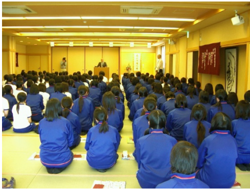
(正座で講話を聴く生徒)