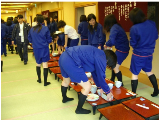
(←食後の後かたづけも自分たちでおこなう)