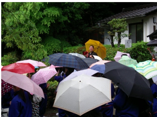
(如意輪寺住職の説明を聞く)

如意輪寺には、北條幕府を倒したあと（1333年）、足利氏との争いのため京都から吉野へ逃れ、失意のうちに亡くなった後醍醐天皇の御陵がある。また、楠木正行（くすのきまさつら）の一族朗党 143 人が四條畷の決戦に向かうに当たり「かゑらじと かねておもえば梓弓 なき数に入る 名をぞとゞむる」との辞世の歌を残した扉もある。吉野は南北朝という日本の歴史を本当に身近に感じられる場所でもある。